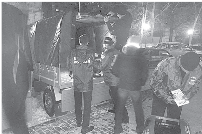
Из Ульяновской области в крымскую Феодосию отправлен гуманитарный груз - комплект мобильных электрогенераторов. Конвой с техникой ушел из Ульяновской области 27 ноября. Полученные два грузовых автомобиля УАЗ и 32 источника автономного электроснабжения - бензиновые электростанции мощностью от 3 до 10 кВт - распределены между учреждениями образования. Они уже доставлены в новый РФ субъект.