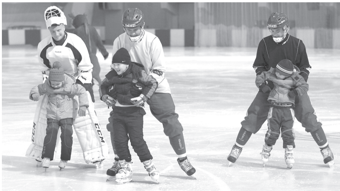
Урок для детсадовцев дают хоккеисты «Волги»...

Федерация хоккея с мячом реализует на территории региона несколько общественно значимых проектов. Четыре из них выставлены для участия в конкурсе «Общественное признание-2015» в номинации «НКО года».